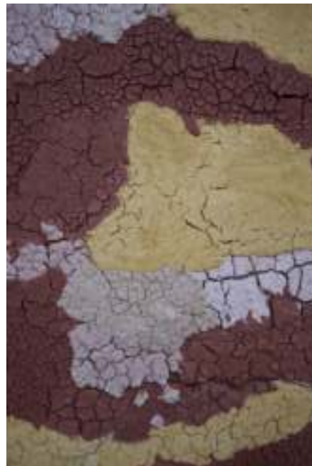
Espejismo del tapón - Cisco Merel