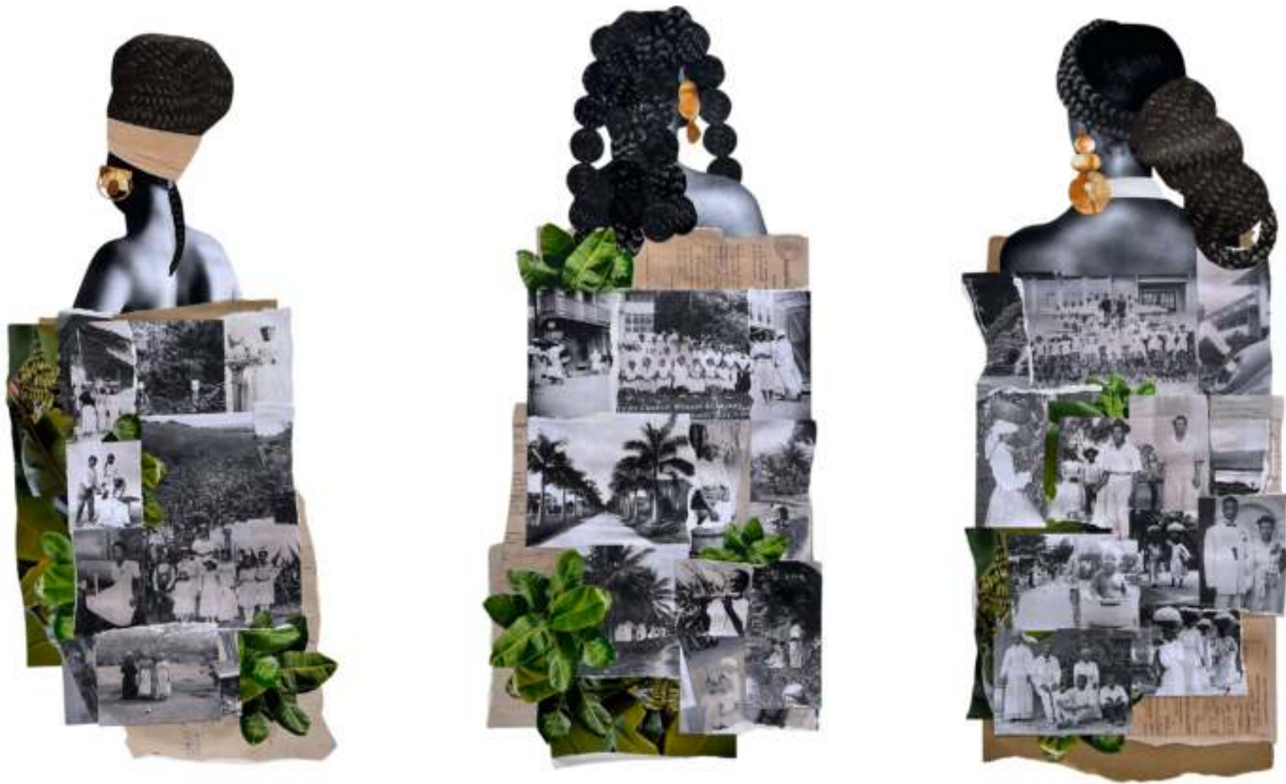
Todo lo que es noble y verdadero - Giana De Dier